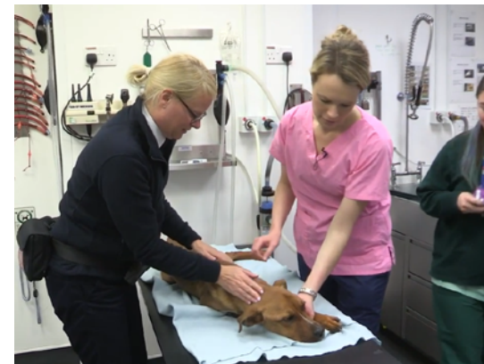
DIOGELU RHAG NIWED