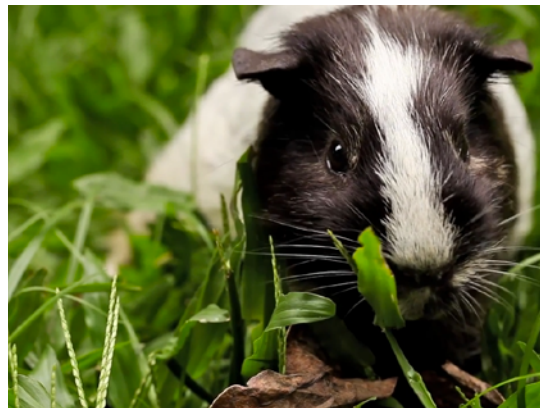
BWYD A DŴR